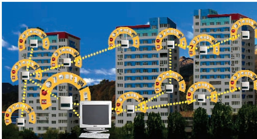
Рис. 4. ОПС больничного комплекса

Больничный комплекс является типичным примером территориально распре-