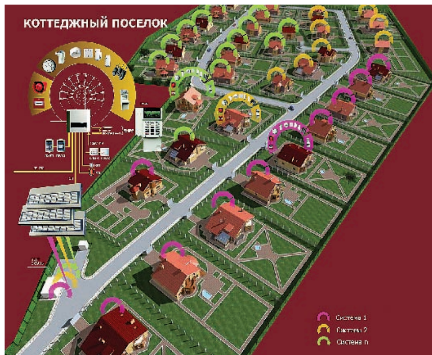
Рис. 2. ОПС коттеджного поселка на базе радиосистемы СТРЕЛЕЦ®

Если задачи мониторинга не ограничиваются созданием только локального поста охраны, то существует возможность трансляции информации на удаленный ПЦН с использованием различных каналов передачи извещений. Например, проводной – устройств автодозвона, высококачественного уплотнения и передачи информации по